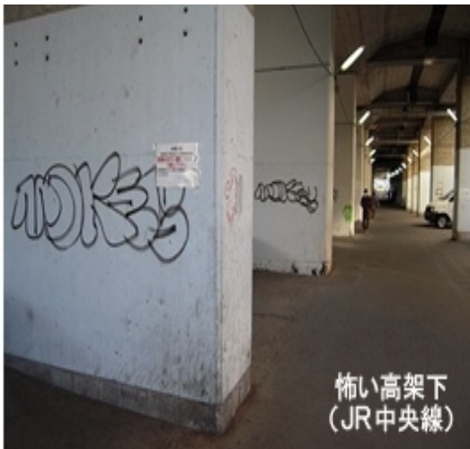
怖い高架下 (JR中央線)

京王線高架計画でも、用途地域が商業地域となっている下高井戸駅周辺は、北側斜線に制限がないために、このような状態が発生します！